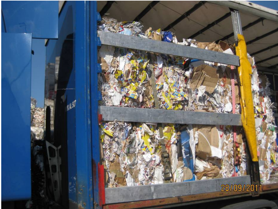
Bild 8: Spiegelbretter in der Seitenwand (aus Holz oder Aluminium). Ein Spiegelbrett im Depot und ein Spiegelbrett überhalb der Schwerpunktlage je Altpapierballen