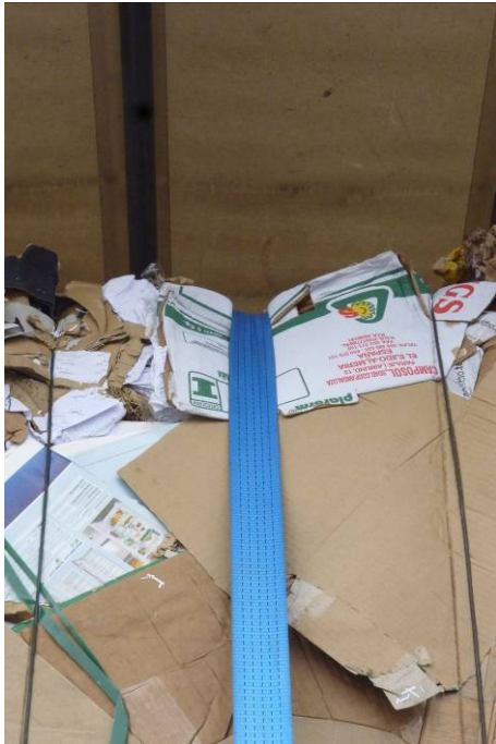
Bild 5: Einschneiden (Stabilisieren) des Zurrgurtes ins Altpapier